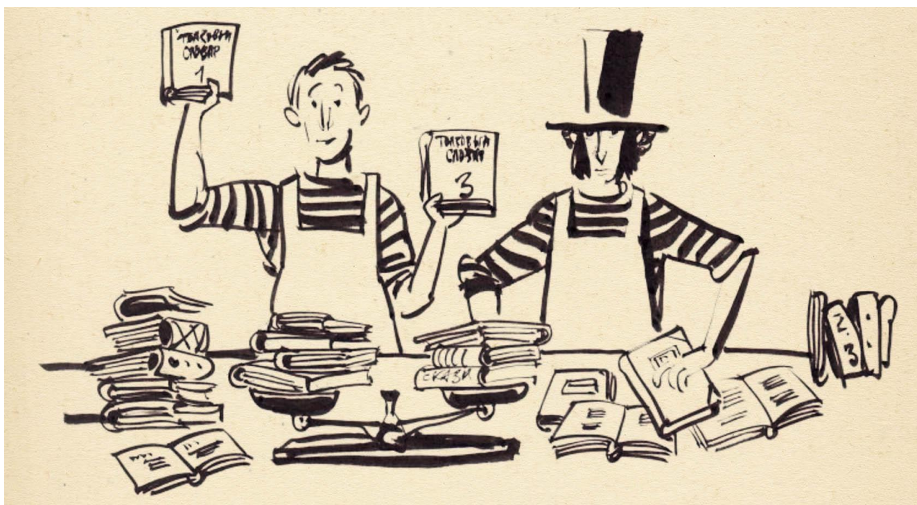
Иллюстрация: Евгения Двоскина для выставочного проекта «Рыцари слова: Александр Пушкин и Владимир Даль» Государственного музея истории российской литературы имени В. И. Даля (2001 г.)