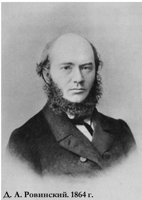
Д. А. Ровинский. 1864 г.

Ровинский Дмитрий Александрович (1824-1895), юрист, историк искусства, библиофил, собиратель графики. Родился в Москве в семье полицеймейстера. В 1844 году закончил Петербургское училище правоведения и начал службу в Министерстве юстиции. В 1848 году переехал в Москву, где прожил двадцать два года: служил по юридической части – сначала стряпчим, потом товарищем председателя Московской уголовной палаты, в 1853-1868 годах московским губернским прокурором, в 1868-1870 годах – председателем Уголовного департамента Московской судебной палаты. В 1870 году Дмитрий Александрович получил высокую должность сенатора Уголовного кассационного департамента и вернулся в Петербург.