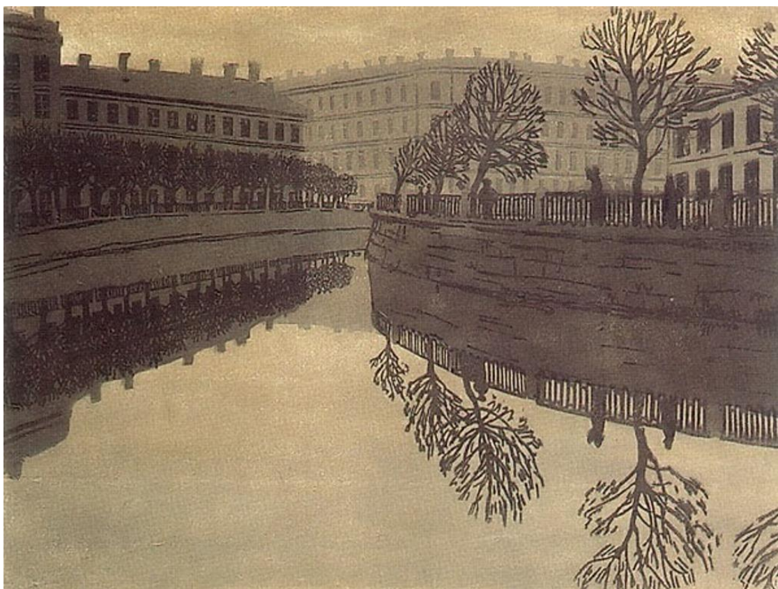
Остроумова-Лебедева А. П. «Екатерининский канал». Литография. 1910 г.