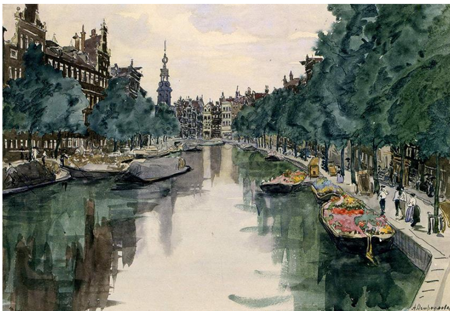
Остроумова-Лебедева А. П. «Амстердам». Акварель. 1913 г.