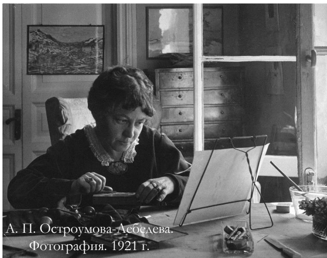
А. П. Остроумова-Лебедева. Фотография. 1921 г.